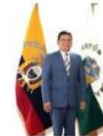
Manuel González Alcalde del cantón Zamora

INFORME INSTITUCIONAL DE RENDICIÓN DE CUENTAS 2021