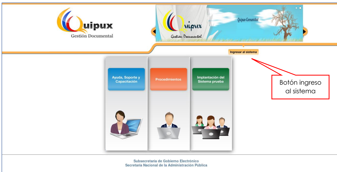
Figura 1. Interfaz principal del SGD Quipux

En esta pantalla se encuentra disponible un botón llamado [INGRESO AL SISTEMA] , al ingresar a esta opción se nos mostrara la siguiente interfaz, ver Figura Nro. 3