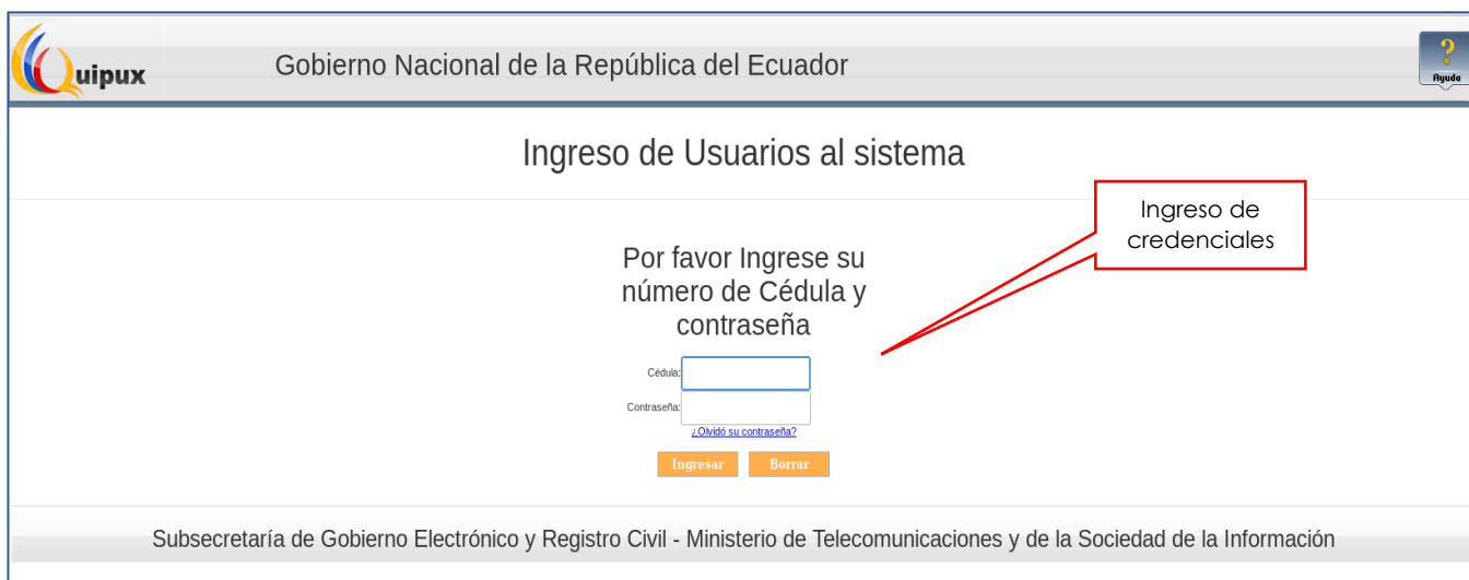
Figura 2. Ingreso al SGD Quipux

En esta pantalla se encuentra disponible un botón llamado [INGRESO AL SISTEMA] , al ingresar a esta opción se nos mostrara la siguiente interfaz, ver Figura Nro. 3