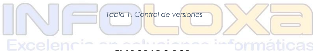
Tabla 1. Control de versiones